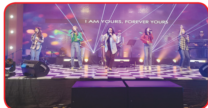
Pujian - pujian dari The City Light.

Tapi Tuhan memberi ruang bagi manusia untuk mengalami dan menikmati sesuatu tentang Tuhan dalam Anugerah dan Kebenaran sepenuhnya. • siebie/frankie yakop.