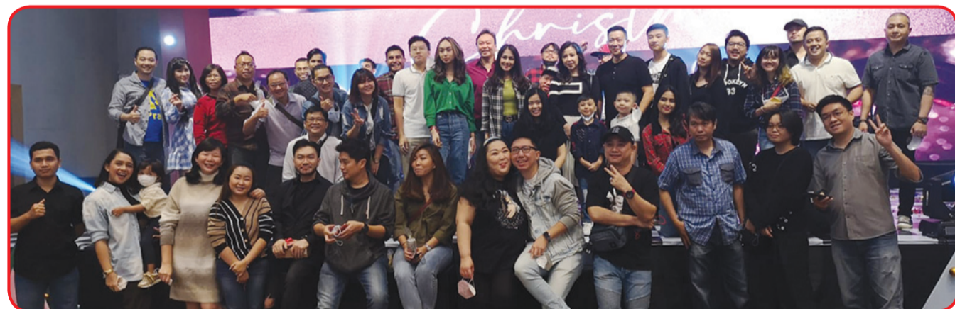
Foto bersama Hamba Tuhan dan Pelayan Tuhan.