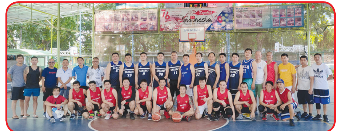
Anggota tim usia 41 hingga 55 tahun berfoto bersama dengan pengurus Sahabat Basketball Club.