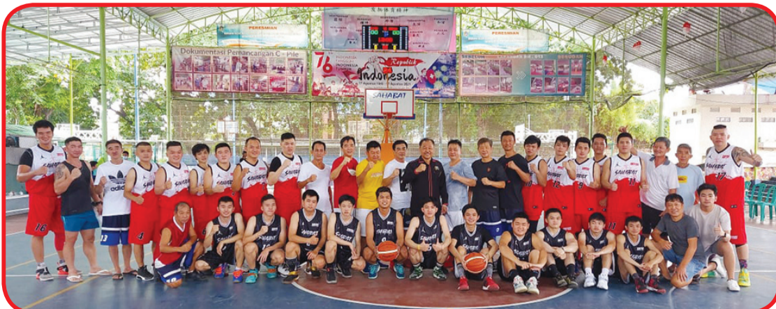
Anggota tim berusia di bawah 40 tahun berfoto bersama dengan pengurus Sahabat Basketball Club.