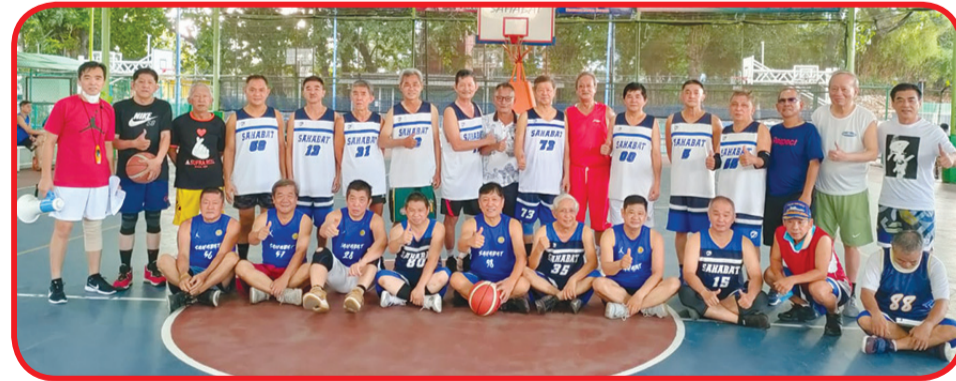
Anggota tim berusia di atas 56 tahun berfoto bersama dengan pengurus Sahabat Basketball Club.

Sahabat Basketball Club Jakarta rutin mengadakan latihan setiap hari Selasa, Kamis dan Minggu dari pukul 07.00 hingga 10.00 pagi. Dan setiap Jumat malam pukul 20.00 hingga 22.00. • idn/din