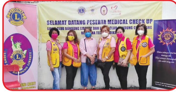
Anggota Lions Club berfoto bersama.