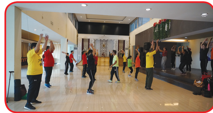
Suasana latihan senam AW 3S.