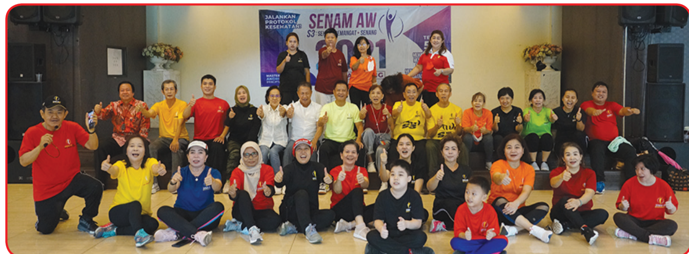
Anggota Perhimpunan Marga Huang Jakarta berfoto bersama.