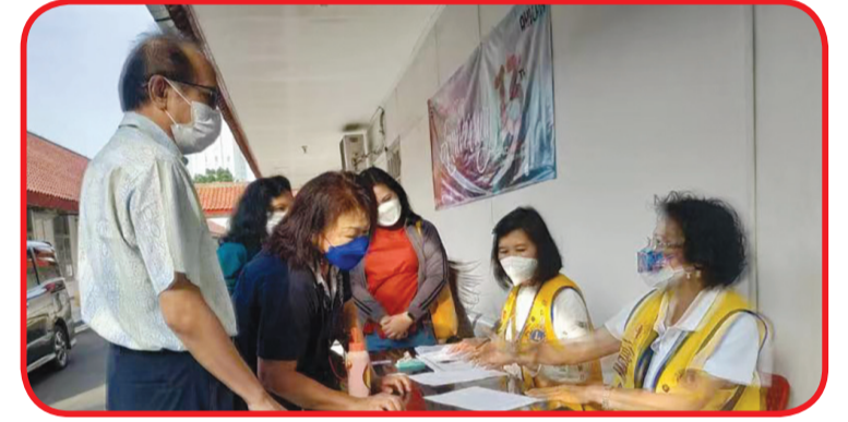
Loket pendaftaran pengecekan darah.