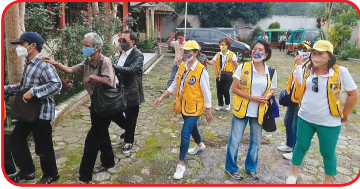
Anggota Lions Club tiba di lokasi rapat.

Namun diharapkan dapat membantu mereka yang membutuhkan. • idn/din